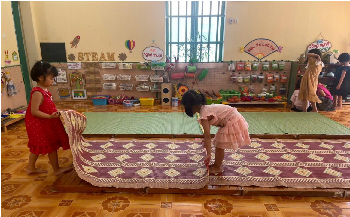
Hình ảnh trẻ đang giúp cô trải chiếu

Trong giờ ngủ, tôi chú trọng tạo không gian yên tĩnh, ấm áp và an toàn. Trẻ được tự trải chiếu, lấy gối, xếp chăn dưới sự hướng dẫn của cô. Trước khi ngủ, tôi thường kể chuyện nhẹ nhàng, mở nhạc êm dịu hoặc cho trẻ chia sẻ những điều vui trong ngày để giúp trẻ thư giãn, dễ đi vào giấc ngủ. Với những trẻ khó ngủ, tôi quan tâm gần gũi, vỗ về, tạo cảm giác được yêu thương, giúp trẻ yên tâm và thoải mái.