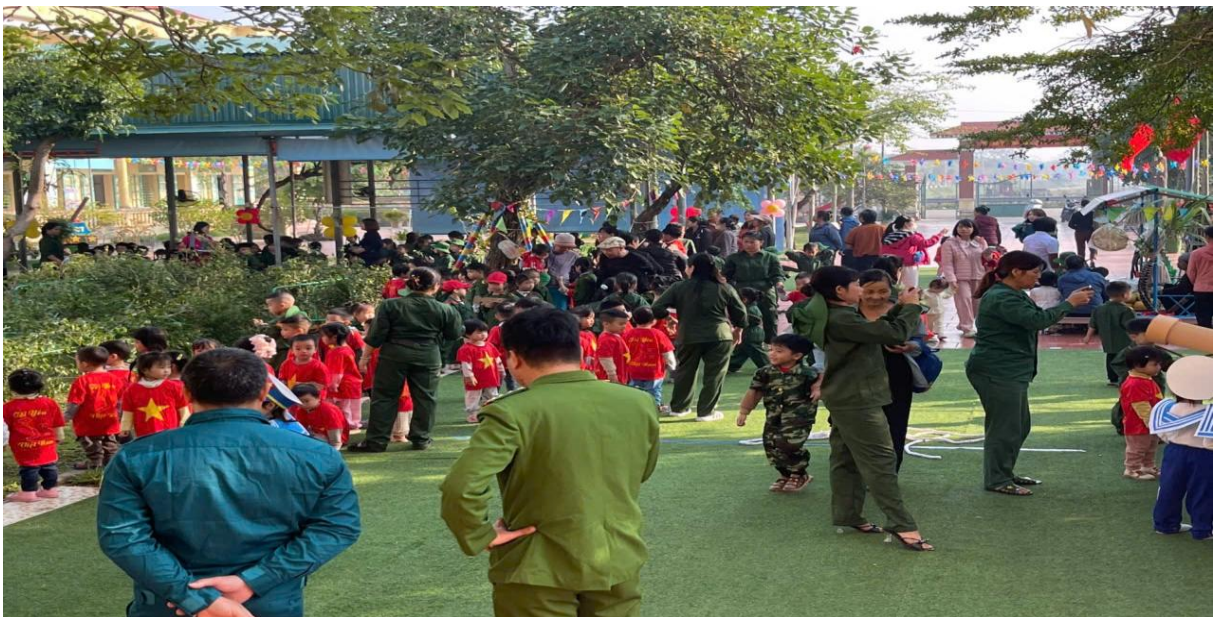
. Hình ảnh phụ huynh phối hợp trong ngày 22/12