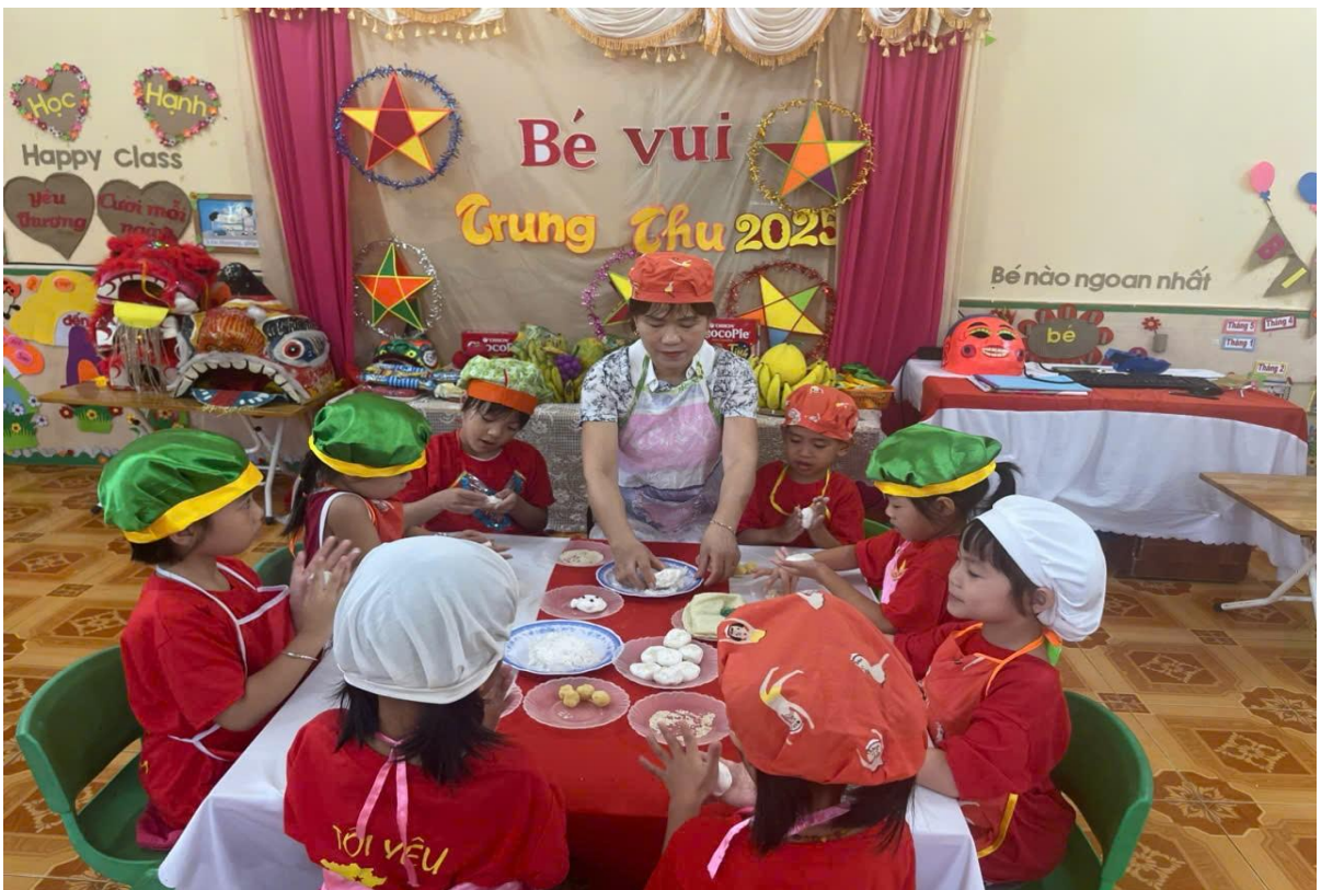
Hình ảnh trẻ đang làm bánh trung thu

Các con đều rất vui vẻ và mong chờ đến ngày lễ, các con đều thấy hạnh phúc khi mình được làm những việc thật ý nghĩa mang lại niềm vui cho mọi người.