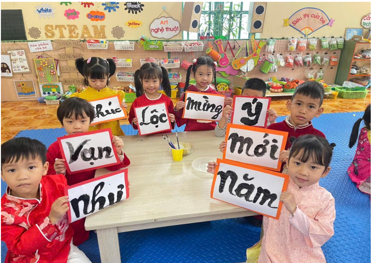
Hình ảnh trẻ viết thư pháp ngày tết