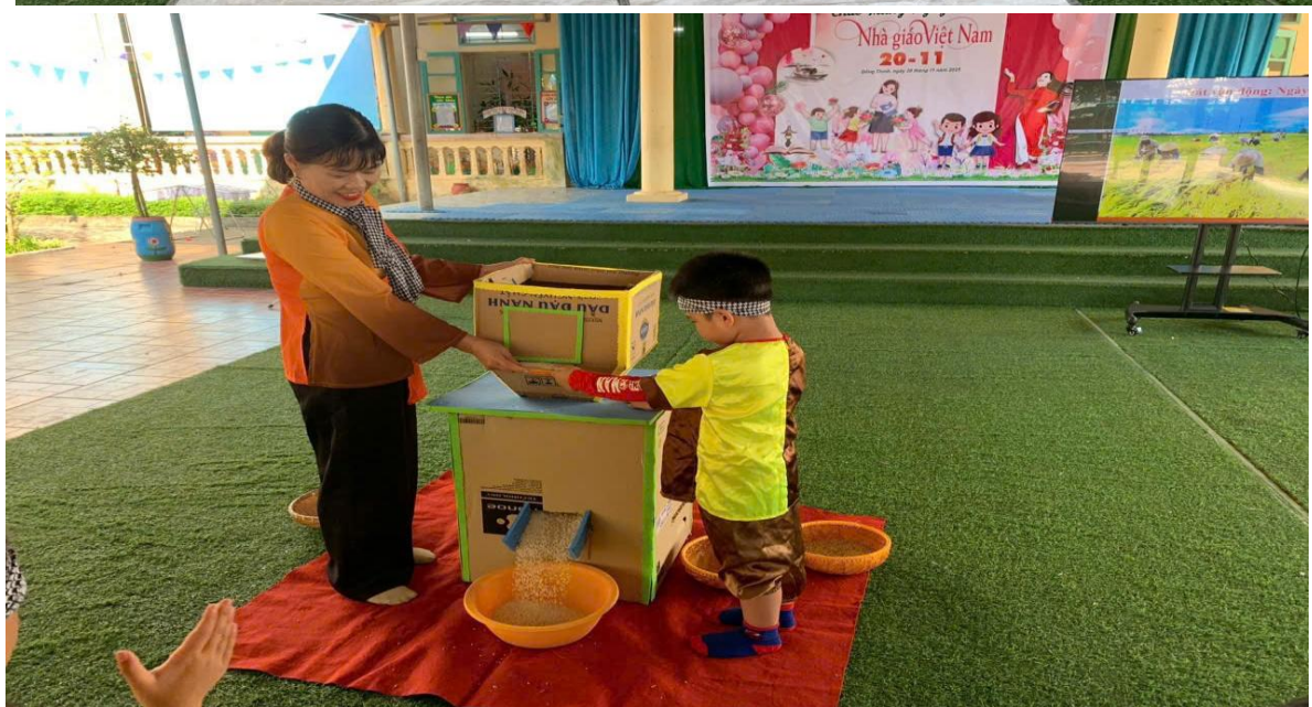
Hình ảnh trẻ đang trải nghiệm làm bác nông dân