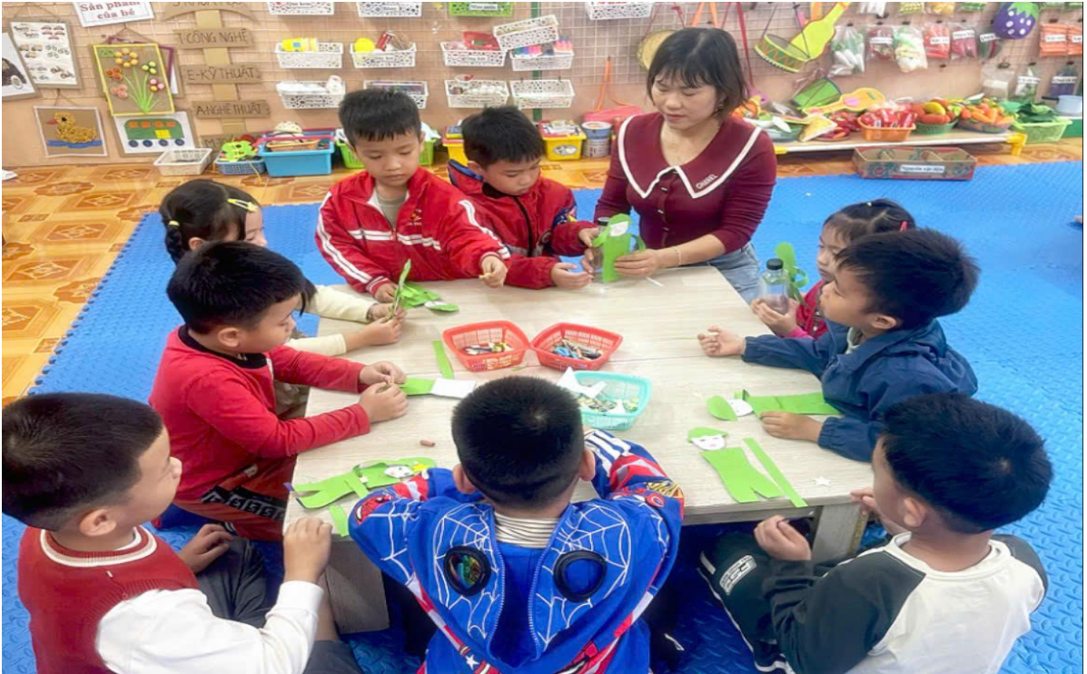
Hình ảnh trẻ đang quan tạo hình chú bộ đội