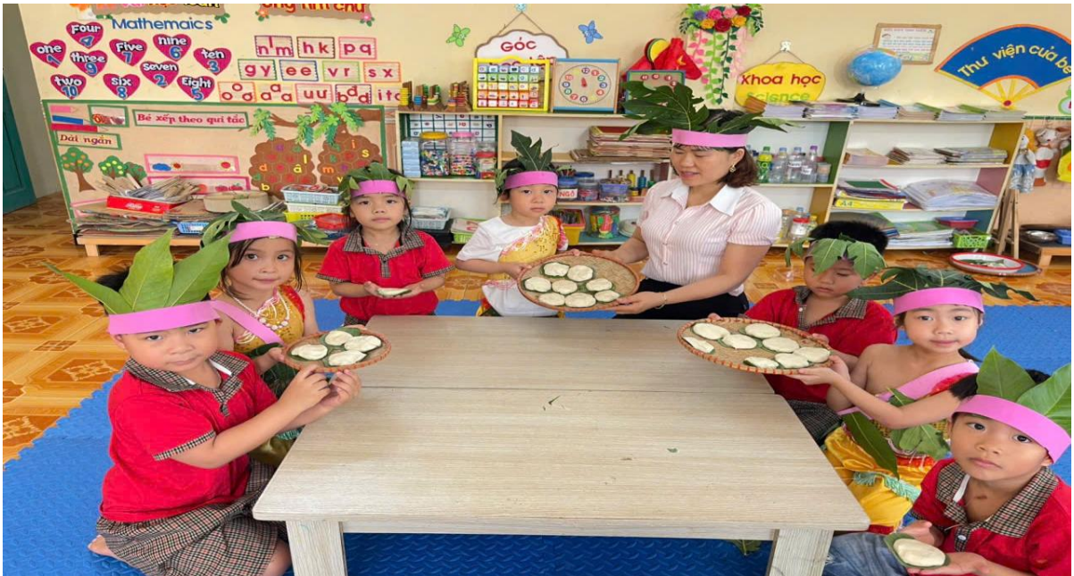
Hình ảnh trẻ trải nghiệm làm bánh dày ngày giỗ tổ Hùng Vương

Đây không chỉ là một hoạt động thực hành gần gũi, phù hợp với lứa tuổi mầm non mà còn là dịp để trẻ được chạm vào những giá trị văn hóa truyền thống bằng những trải nghiệm thật, cảm xúc thật và sự tham gia thật của chính mình. Từ những điều nhỏ bé, gần gũi các cô đã dần gieo mầm, về tình yêu quê hương, đất nước, lòng biết ơn tổ tiên và niềm tự hào là người con đất Việt cho trẻ