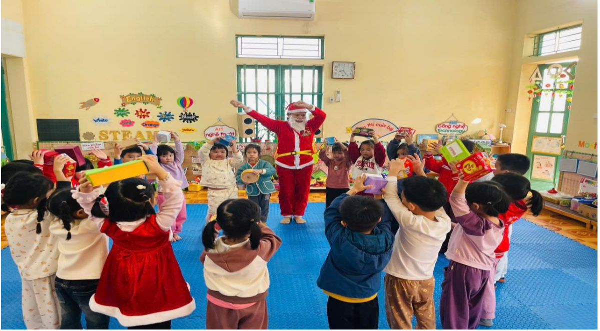
Hình ảnh trẻ được ông già Noel tặng quà

Trong lễ hội mừng xuân trẻ được tham gia rất nhiều các hoạt động trải nghiệm: trẻ được trực tiếp lau lá dong, đong gạo, xếp thịt, cùng mẹ và buộc bánh, luộc bánh trưng. Trong quá trình gói xôi trò chuyện với trẻ để trẻ biết được các nguyên vật liệu để gói bánh. Để gói được bánh trưng thì theo con cần những nguyên liệu gì? Trẻ kể các nguyên liệu để làm bánh, Hỏi trẻ các bước để gói bánh trưng. Qua những câu hỏi gợi mở như: "Theo con, tại sao bánh chưng lại có hình vuông?" hay "Lá dong có mùi thơm gì?", trẻ sẽ tự đúc rút được kiến thức một cách tự nhiên nhất. từ đó cho trẻ rút ra kinh nghiệm của bản thân.