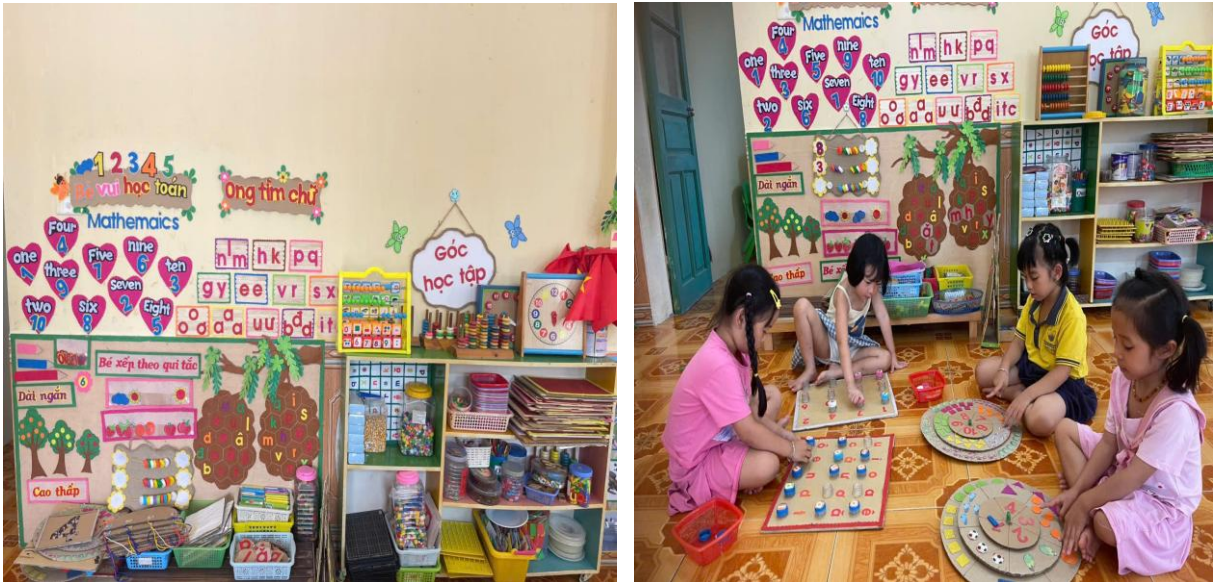
Hình ảnh trẻ đang chơi trong góc

Thiết kế "Không gian hạnh phúc" trong lớp học. Góc cảm xúc Thiết kế một góc nhỏ có gương, các biểu tượng cảm xúc (vui, buồn, giận dữ, sợ hãi). Trẻ có thể đến đây để tự soi gương và gọi tên cảm xúc của mình. Hộp thư "Điều con muốn nói": Nơi trẻ có thể vẽ tranh hoặc nhờ cô ghi lại những mong muốn,