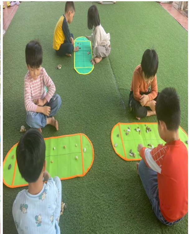
Hình ảnh trẻ đang chơi các trò chơi dân gian