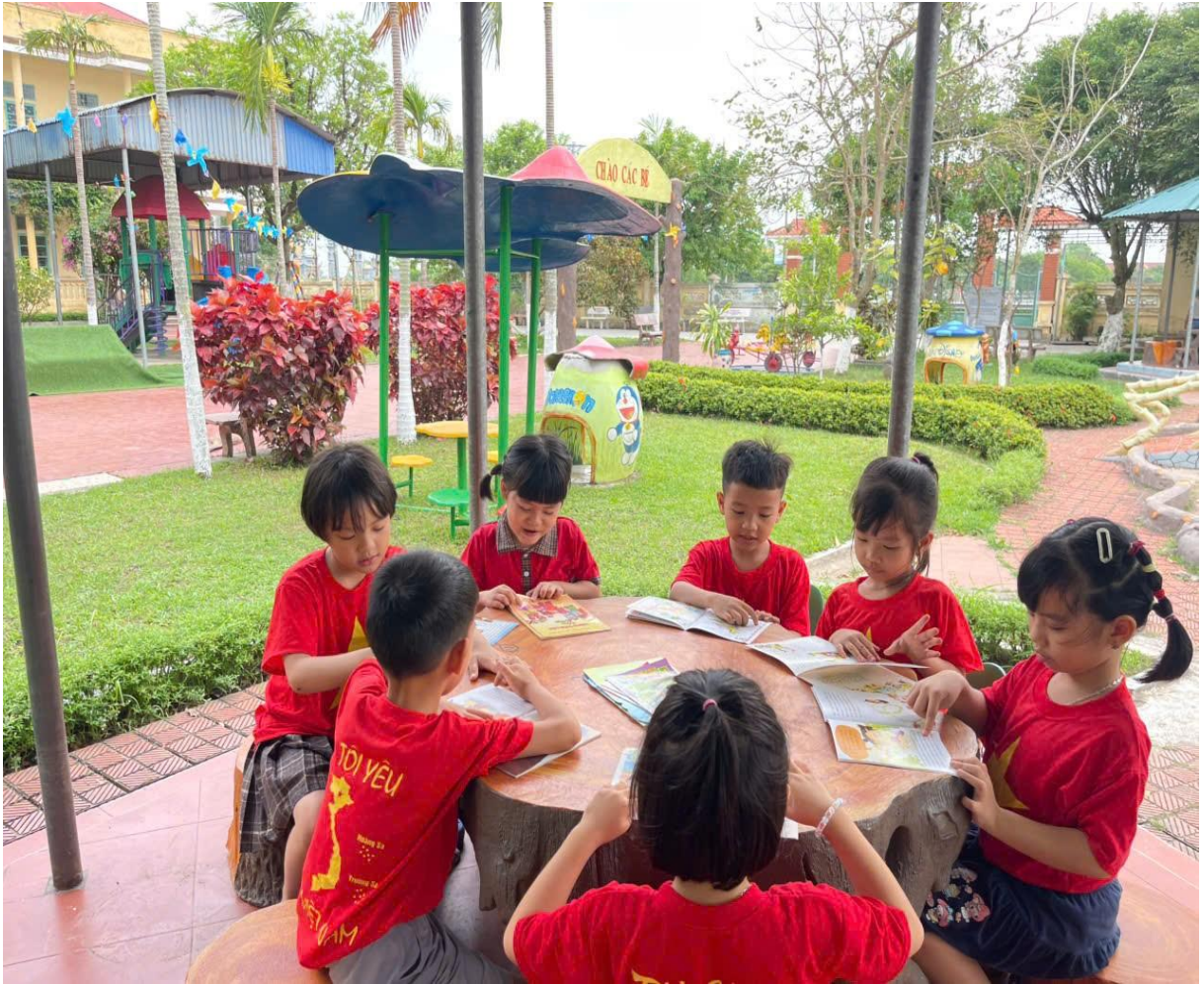
Hình ảnh trẻ đang xem sách, truyện

Xây dựng môi trường đa dạng, phong phú hấp dẫn sẽ gây hứng thú cho trẻ và tạo ra kết quả của hoạt động cao nhất. Khi tạo được môi trường thân thiện như vậy thì kết quả cho thấy các cháu rất thích đến lớp, thích tham gia các hoạt động cùng cô cùng bạn.