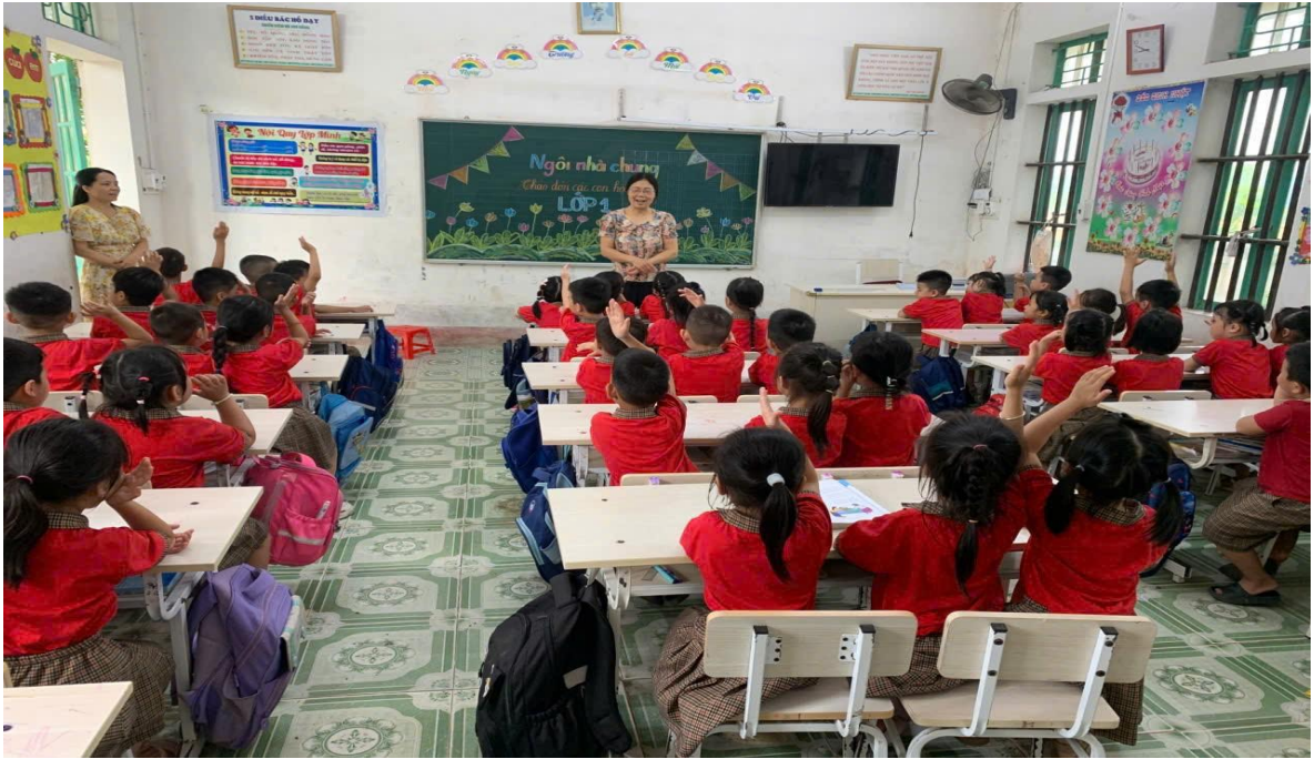
Hình ảnh trẻ trải nghiệm tham quan trường Tiểu học

Các bé được giao lưu, trò chuyện với cô giáo và các anh chị lớp 1. Các con được đi thăm quan các phòng chức năng. Đây sẽ là kỉ niệm đáng nhớ nhất của các bé trước khi rời trường Mầm non thân yêu để mạnh dạn, tự tin bước vào lớp 1.