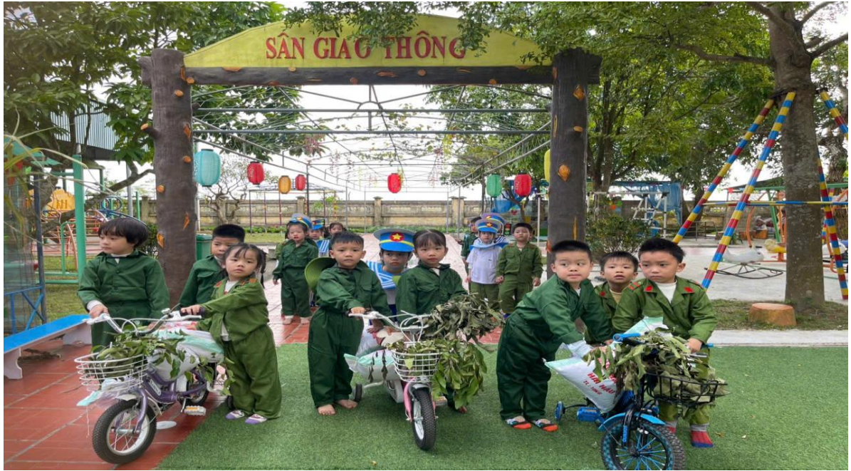
Hình ảnh trẻ trải nghiệm làm chủ bộ đội

Đây không chỉ là một hoạt động thực hành gần gũi, phù hợp với lứa tuổi mầm non mà còn là dịp để trẻ được chạm vào những giá trị văn hóa truyền thống bằng những trải nghiệm thật, cảm xúc thật và sự tham gia thật của chính mình. Từ những điều nhỏ bé, gần gũi các cô đã dần gieo mầm, về tình yêu quê hương, đất nước, lòng biết ơn tổ tiên và niềm tự hào là người con đất Việt cho trẻ