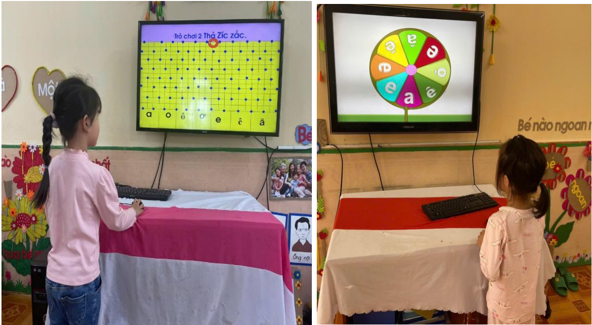
Hình ảnh trẻ đang chơi trò chơi trên máy vi tính

Để phục vụ tốt cho công tác chăm sóc và giáo dục trẻ tôi luôn tìm tòi, khai thác tài nguyên giáo dục phong phú để khám phá nội dung bài giảng cho trẻ. Khi thiết kế bài dạy tôi khai thác các hình ảnh trên trang web, thư viện bài giảng. Bên cạnh đó, tôi còn tích cực tự học hỏi thêm kiến thức về tin học, một số thủ thuật từ các trang mạng xã hội và chị, em đồng nghiệp, Để thuận tiện trong công tác giảng dạy cũng như thiết kế giáo án soạn giảng, thiết kế trò chơi thông minh Thiết kế video hoạt hình từ ứng dụng AI và các phần mềm khác