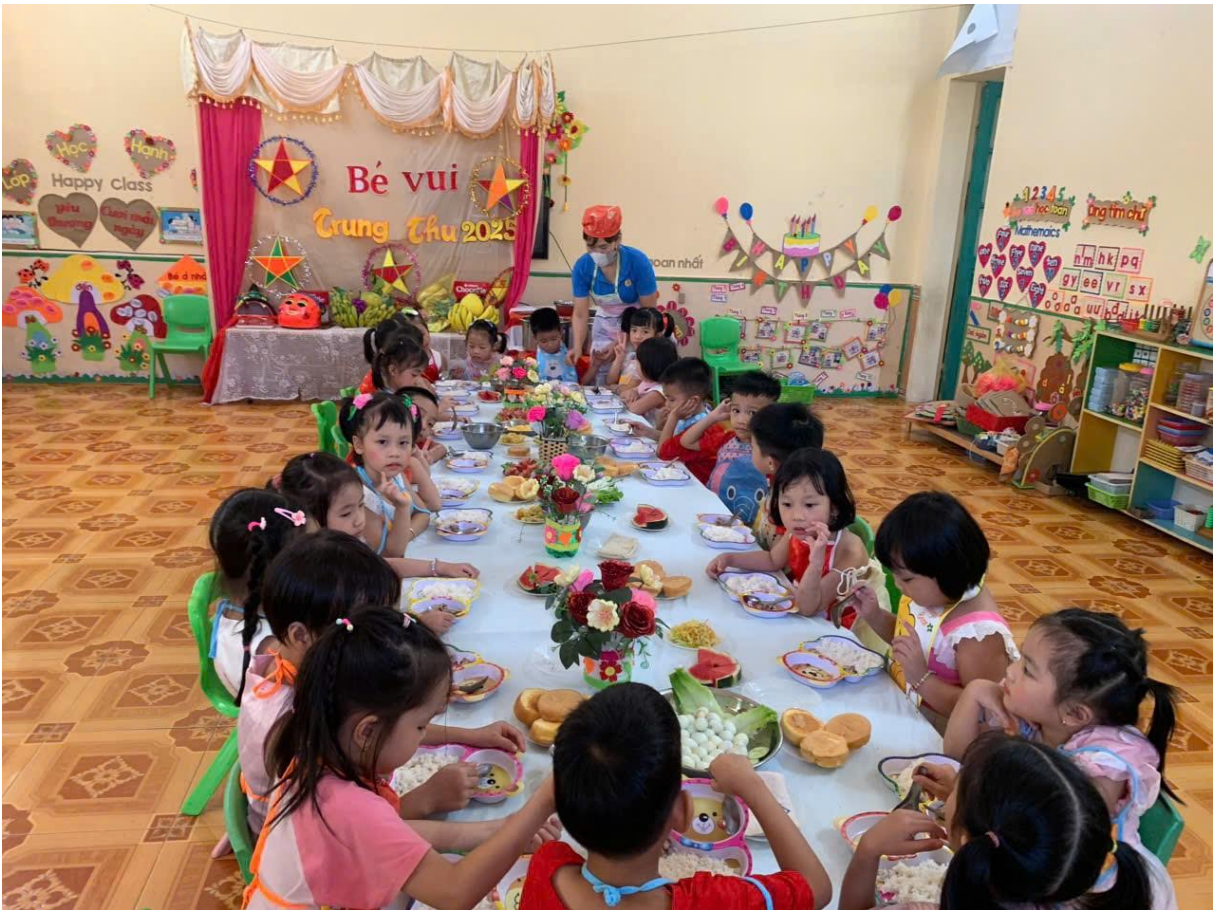
Hình ảnh trẻ đang ăn cơm tại lớp

Ngoài ra tôi còn tổ chức cho trẻ trải nghiệm ăn buffet tại lớp. Việc tổ chức cho trẻ ăn buffet tại lớp mang nhiều ý nghĩa thiết thực đối với sự phát triển toàn diện của trẻ mầm non. Thông qua hoạt động này, trẻ được rèn luyện tính tự lập, biết tự lựa chọn món ăn phù hợp với sở thích và nhu cầu của bản thân, đồng thời hình thành thói quen ăn uống văn minh như xếp hàng, chờ đến lượt, không chen lấn và biết chia sẻ với bạn bè. Buffet còn tạo cơ hội để trẻ phát triển kỹ năng giao tiếp, mạnh dạn trao đổi, tương tác trong môi trường tập thể vui vẻ, thân