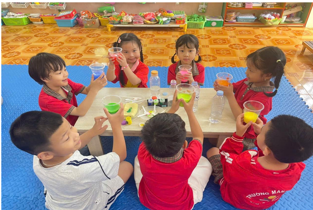
Hình ảnh trẻ đang làm thí nghiệm sự kỳ diệu của nước