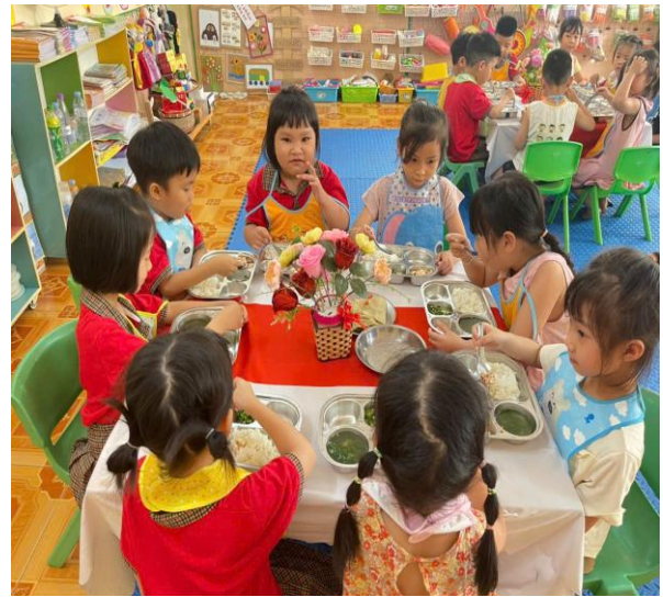
Hình ảnh trẻ đang ăn cơm tại lớp