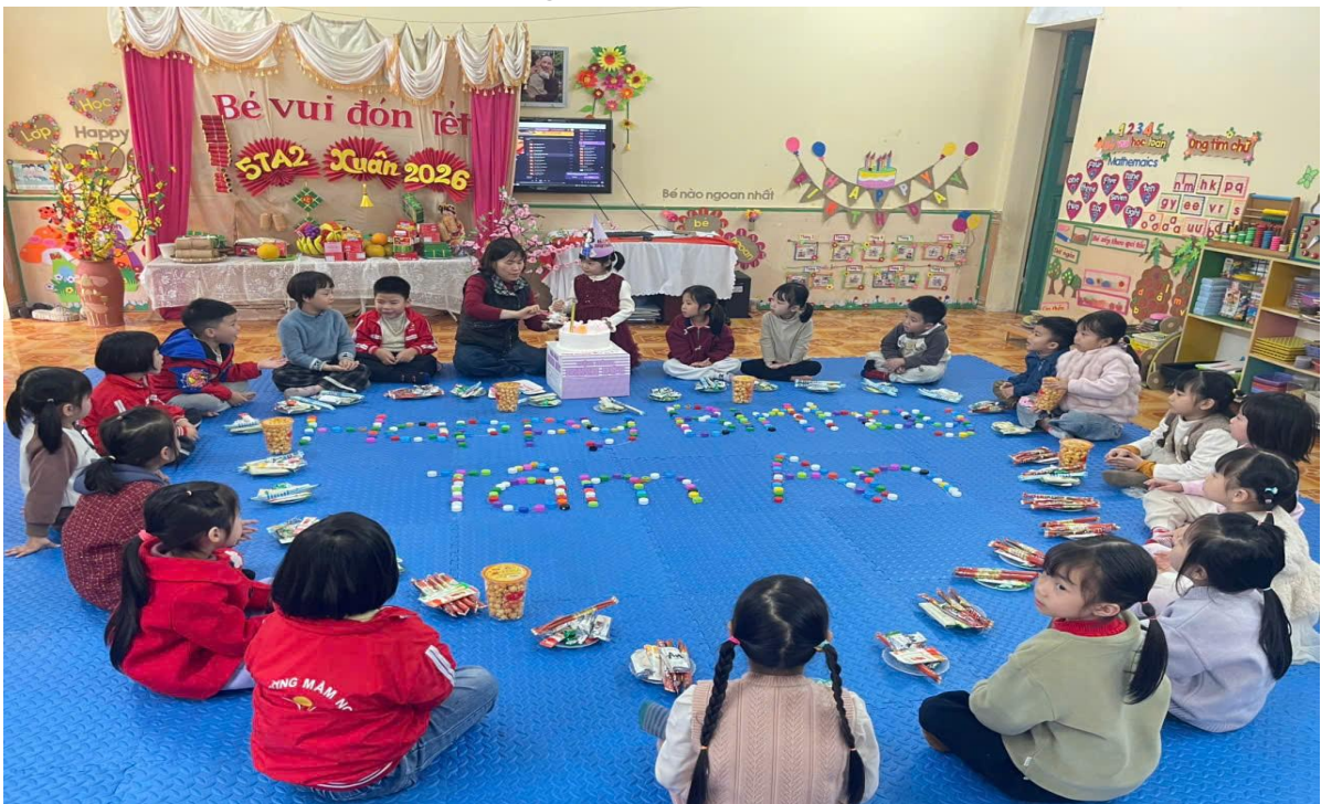
Hình ảnh trẻ chúc mừng sinh nhật

Khi được cô giáo tổ chức sinh nhật hay tặng quà vào các dịp như, lễ tết, Noel...trẻ cảm nhận rõ niềm vui, sự bất ngờ và cảm giác được yêu thương, quan tâm. Những khoảnh khắc ấy giúp trẻ mạnh dạn thể hiện cảm xúc, biết nói lời cảm ơn, chia sẻ niềm vui với bạn bè và hình thành những kỷ niệm đẹp trong môi trường lớp học. Từ đó, trẻ thêm gắn bó với cô và bạn, cảm thấy an toàn, hạnh phúc khi đến trường, góp phần nuôi dưỡng cảm xúc tích cực và phát triển nhân cách một cách tự nhiên, bền vững.