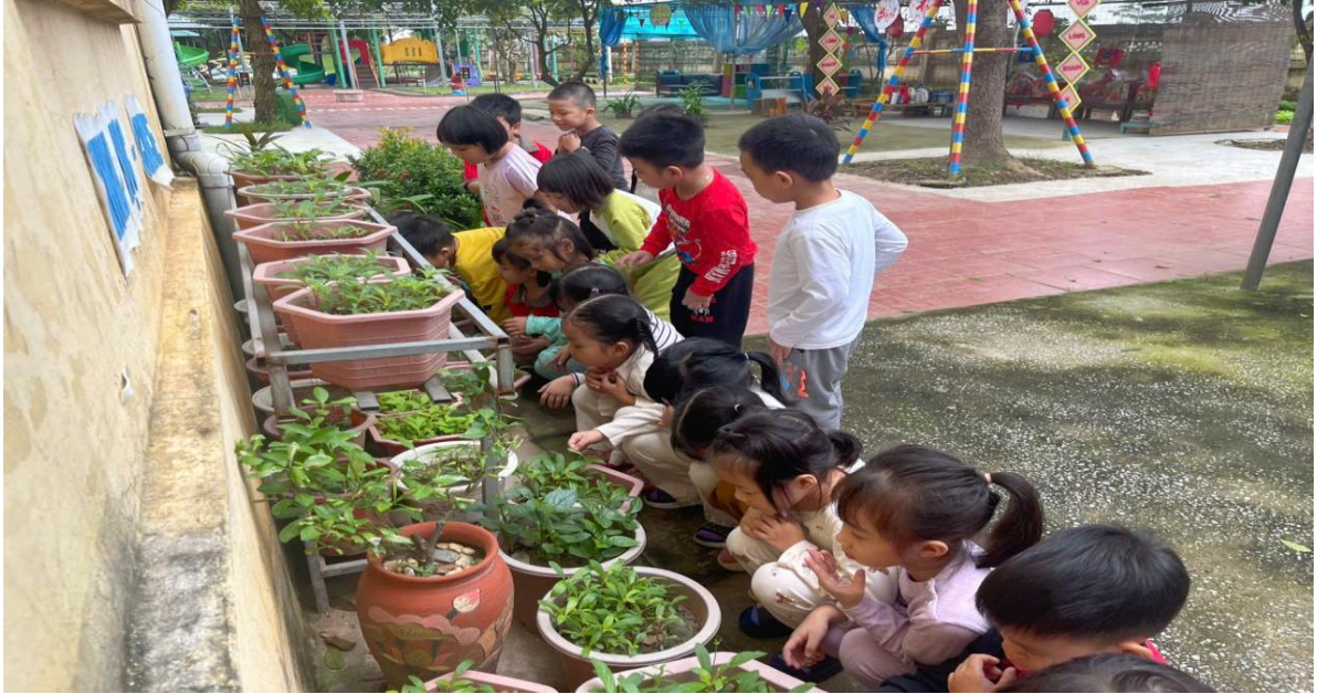
Hình ảnh trẻ đang quan sát sự phát triển của cây, rau