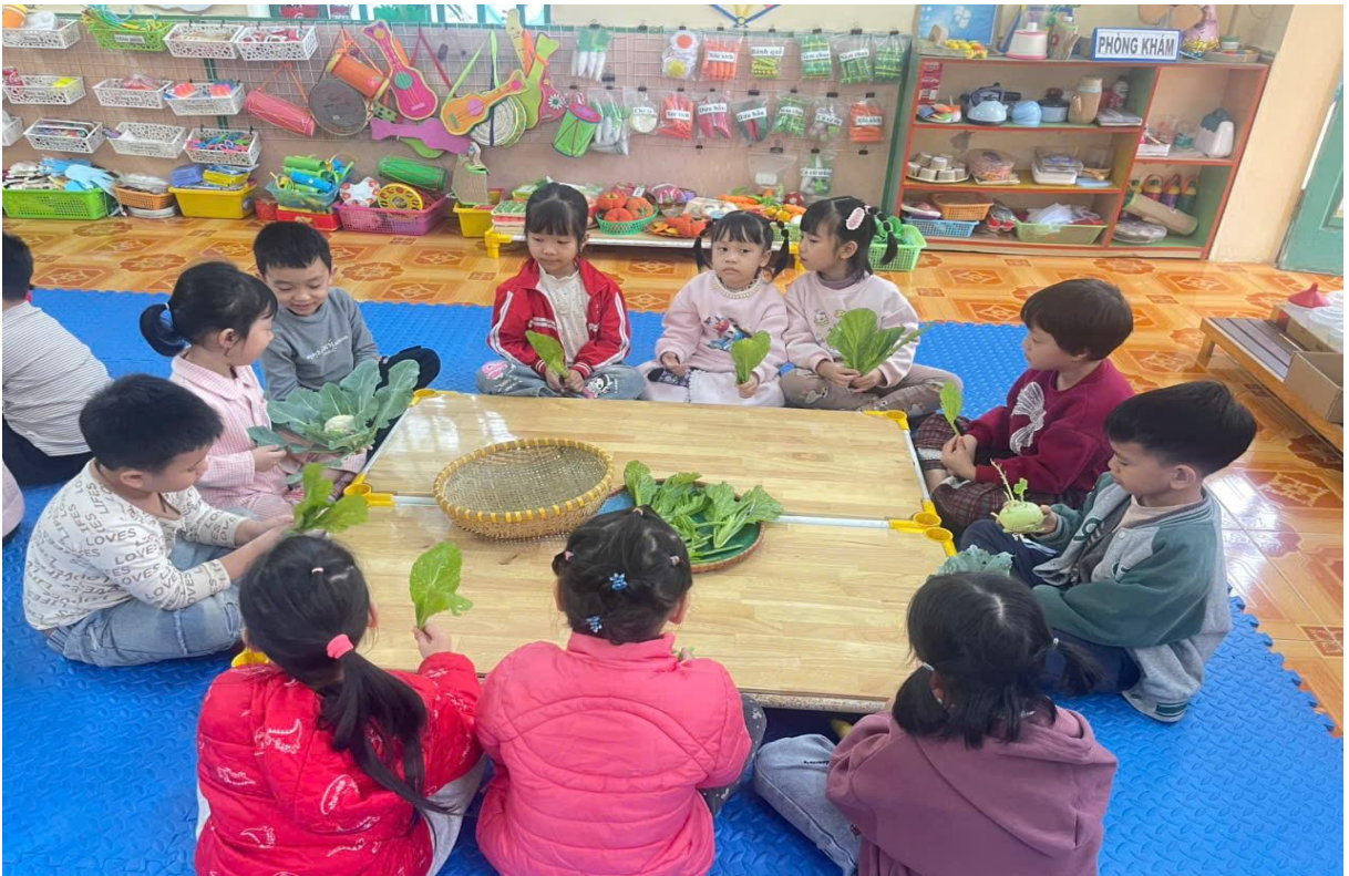
Hình ảnh trẻ khám phá các loại rau, củ

Trong hoạt động khám phá về các loại rau củ quả tôi cho trẻ tạo nhóm cùng nhau khám phá về các loại rau củ của nhóm mình, từ đó trẻ chia sẻ những hiểu biết, cảm nhận của mình về những loại rau củ đó.