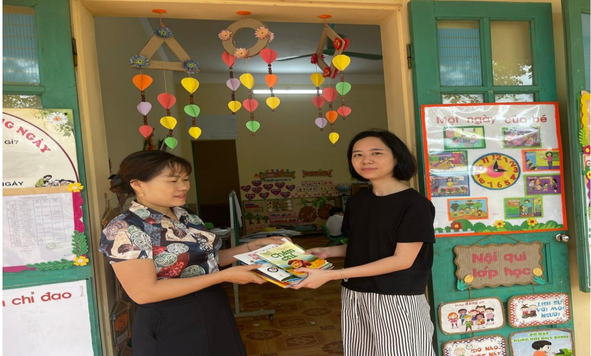
. Hình ảnh phụ huynh ủng hộ sách truyện

Trong tất cả các sự kiện lớn trong năm chúng tôi đều được phụ huynh nhiệt tình tham gia và ủng hộ