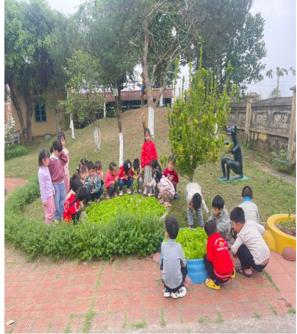
Hình ảnh trẻ đang quan sát vườn rau, vườn cây

Qua việc tổ chức cho trẻ khám phá, quan sát cây cối, vườn rau... thiên nhiên xung quanh bé thì tôi thấy rằng trẻ rất hứng thú tham gia tích cực vào hoạt động, Vốn sống, vốn kinh nghiệm, hiểu biết của trẻ về môi trường thiên nhiên phát triển rõ rệt, hiệu quả của giờ học cao hơn, trẻ hứng thú nhanh nhẹn, mạnh dạn tự tin tích cực tham gia vào các hoạt động. Khi ra ngoài trời, trẻ cùng cô gieo hạt, cùng cô chăm sóc, Từ đó trẻ hiểu được mối quan hệ nhân quả: Muốn có nhiều, quả thì phải trồng cây, chăm sóc cây cách qua đó hiểu được giá trị của lao động. Và vui mừng với thành quả mình làm ra