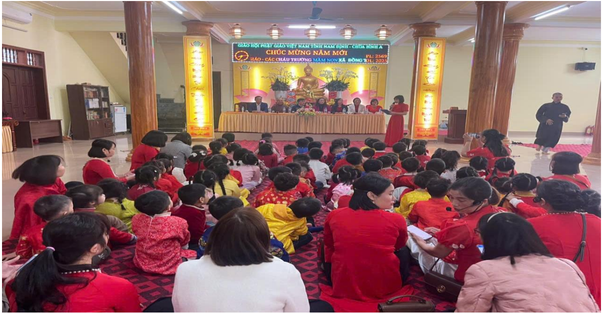
Hình ảnh trẻ trải nghiệm tham quan chùa Bình A

Sau buổi tham quan, tôi tổ chức cho trẻ trò chuyện, chia sẻ cảm xúc với các câu hỏi như: