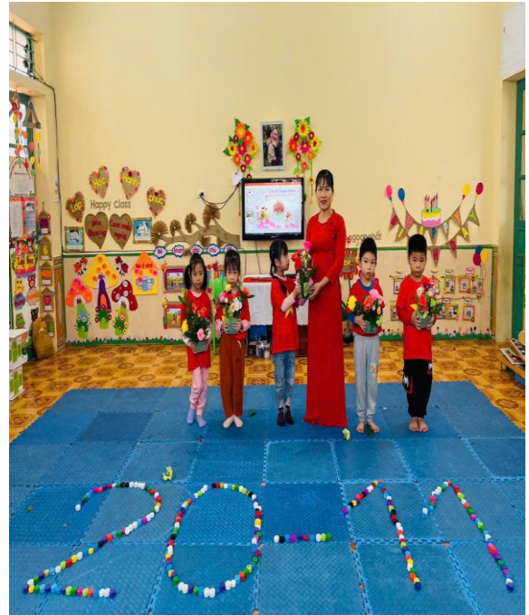
Hình ảnh trẻ đang cắm hoa mừng cô 20/11

Khi được cô giáo tổ chức sinh nhật hay tặng quà vào các dịp như, lễ tết, Noel...trẻ cảm nhận rõ niềm vui, sự bất ngờ và cảm giác được yêu thương, quan tâm. Những khoảnh khắc ấy giúp trẻ mạnh dạn thể hiện cảm xúc, biết nói lời cảm ơn, chia sẻ niềm vui với bạn bè và hình thành những kỷ niệm đẹp trong môi trường lớp học. Từ đó, trẻ thêm gắn bó với cô và bạn, cảm thấy an toàn, hạnh phúc khi đến trường, góp phần nuôi dưỡng cảm xúc tích cực và phát triển nhân cách một cách tự nhiên, bền vững.