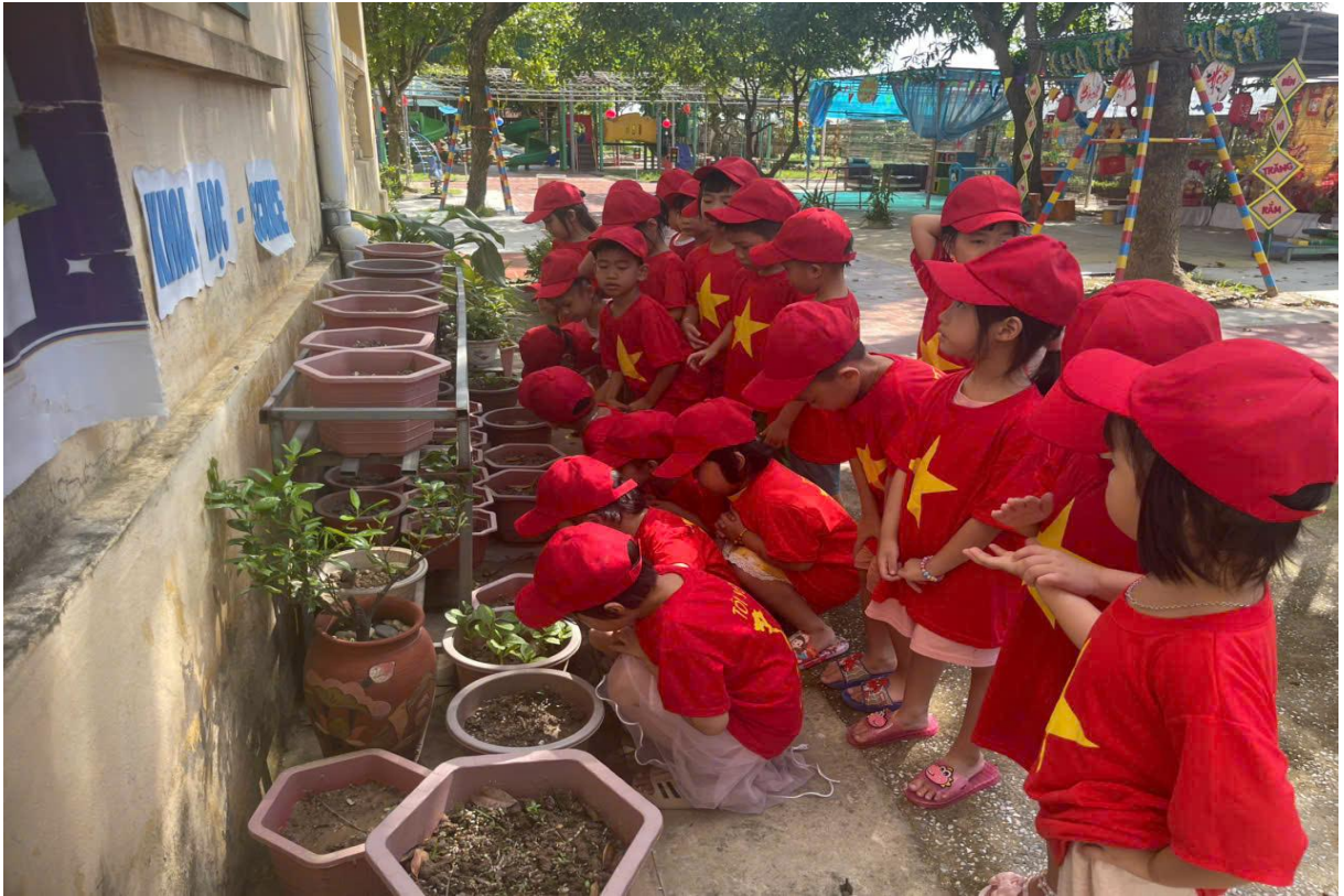
Hình ảnh trẻ đang gieo hạt

Ngoài ra, tôi còn tổ chức cho trẻ thực hiện các thí nghiệm đơn giản như: thí nghiệm hạt nảy mầm, cây cần nước và ánh sáng như thế nào... Qua đó giúp trẻ phát triển khả năng quan sát, tư duy, khám phá khoa học và thêm yêu thiên nhiên, biết bảo vệ môi trường sống xung quanh.