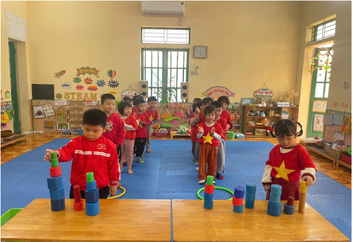
Hình ảnh trẻ đang trải nghiệm xếp chồng các khối

Trong hoạt động khám phá về các loại rau củ quả tôi cho trẻ tạo nhóm cùng nhau khám phá về các loại rau củ của nhóm mình, từ đó trẻ chia sẻ những hiểu biết, cảm nhận của mình về những loại rau củ đó.