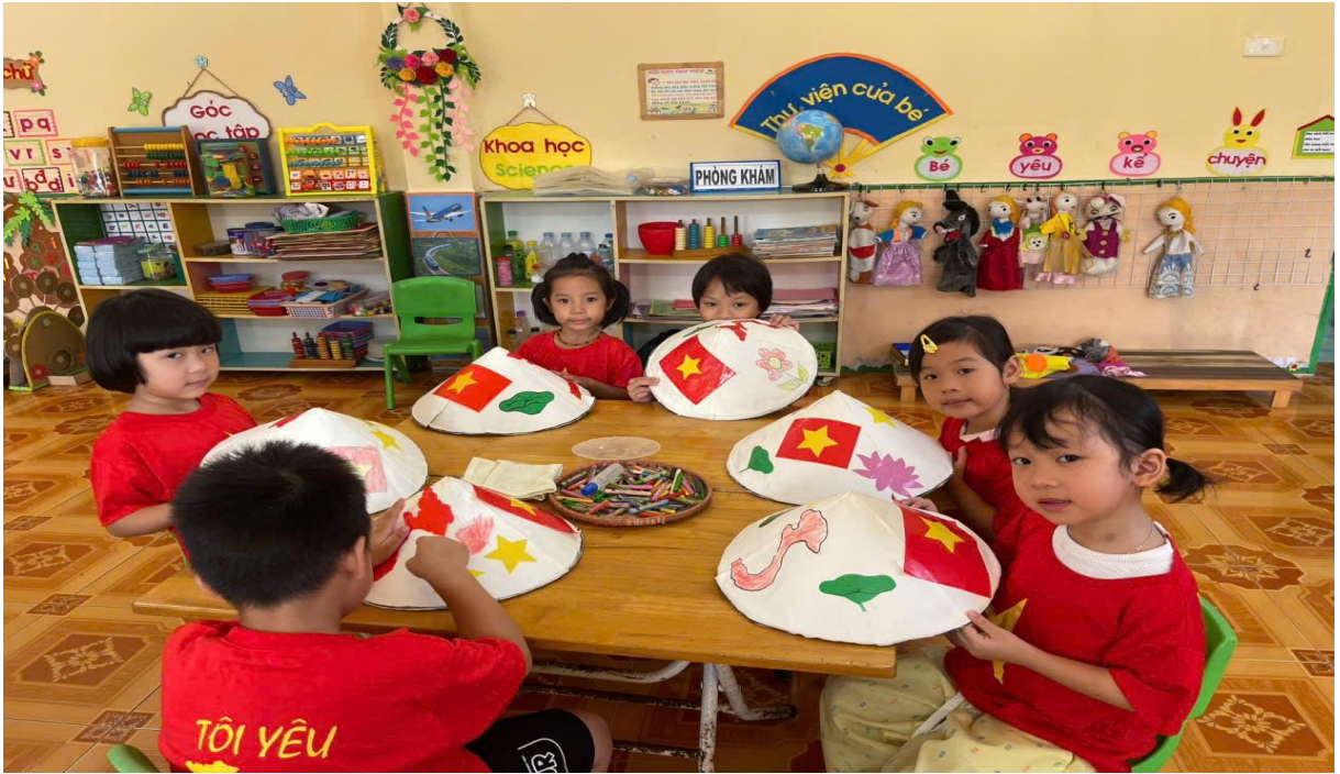
Hình ảnh trẻ đang trang trí nón lá Việt Nam