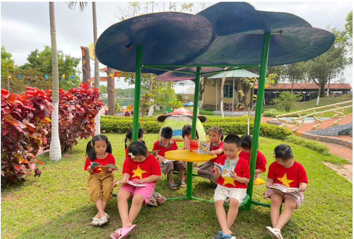
Hình ảnh trẻ đang xem sách, truyện

Nhờ xây dựng môi trường giáo dục đa dạng, phong phú và giàu tính trải nghiệm, trẻ trong lớp tôi ngày càng mạnh dạn, tự tin, tích cực tham gia các hoạt động. Trẻ luôn vui vẻ, hào hứng khi đến trường, yêu lớp, yêu cô và yêu bạn bè hơn. Qua đó góp phần tạo nên một “Lớp học hạnh phúc” thực sự, nơi mỗi ngày đến trường là một ngày vui đối với trẻ.