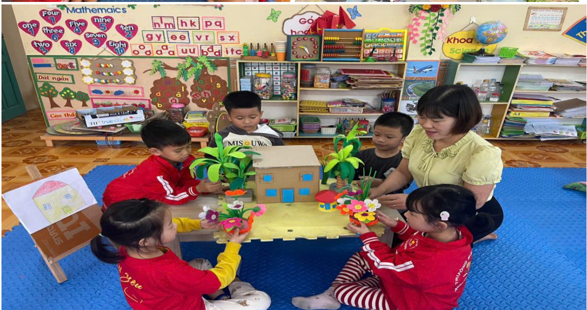
Hình ảnh trẻ đang thiết kế ngôi nhà mơ ước