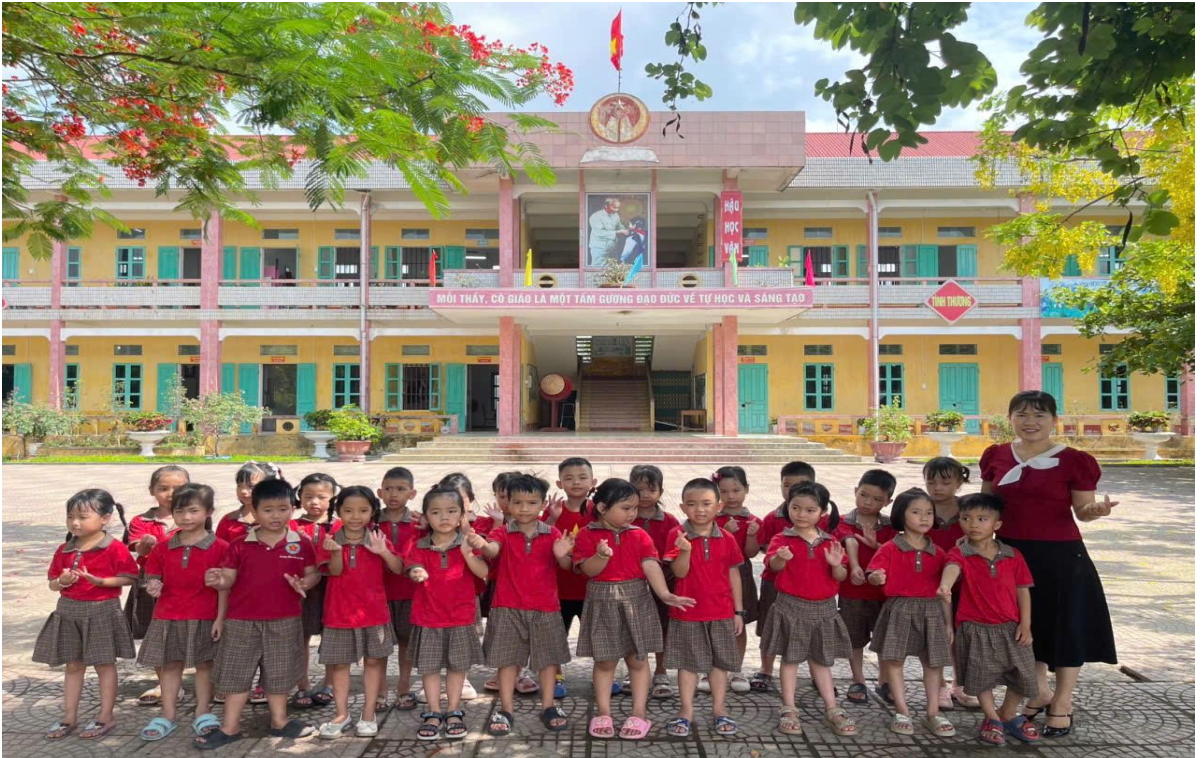
Hình ảnh trẻ trải nghiệm tham quan trường Tiểu học

Sau khi về cô trò chuyện với trẻ: Các con vừa được đi đâu? Gặp gỡ những ai? Các con thấy trường tiểu học có gì khác trường mầm non? Con thích học trường tiểu học không? Tại sao? Trong quá trình trò chuyện cô biết được những suy nghĩ của các con đồng thời giúp các con có thêm hiểu biết và các hoạt động học tập của học sinh tiểu học để các con khỏi ngỡ ngàng khi lên tiểu học. từ đó hình thành tâm lý tự tin, sẵn sàng bước vào giai đoạn học tập mới. Thông qua hoạt động trải nghiệm thực tế, trẻ dần hình thành sự mạnh dạn, tự tin khi