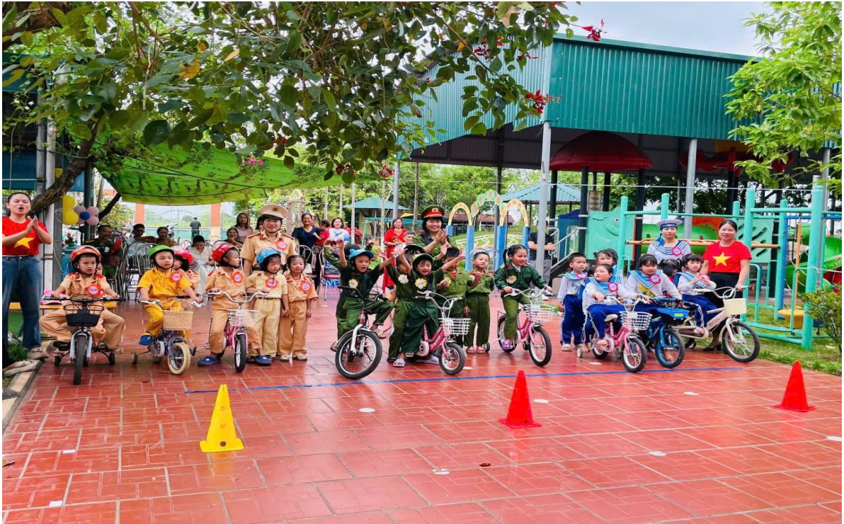
Hình ảnh trẻ trải nghiệm trong chương trình “ Tôi yêu Việt nam”

Sau mỗi hoạt động, tôi đều tổ chức cho trẻ trò chuyện, chia sẻ cảm nhận thông qua các câu hỏi gợi mở như: