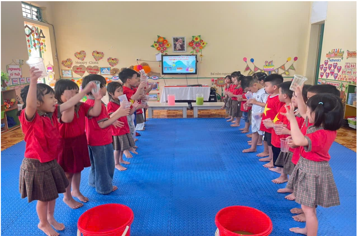
Hình ảnh trẻ đang chuyển nước

Khi trẻ cùng bạn thực hiện những thí nghiệm trẻ sẽ cảm thấy vui, hạnh phúc. Đối với những hoạt động trải nghiệm, tôi tổ chức cho trẻ chơi theo nhóm để cùng thực hiện yêu cầu của cô, qua đó sẽ phát triển kỹ năng hợp tác, đoàn, chia sẻ giúp trẻ yêu thương, phối hợp cùng bạn.