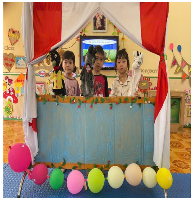
Hình ảnh trẻ đang kể chuyện bằng rối tay