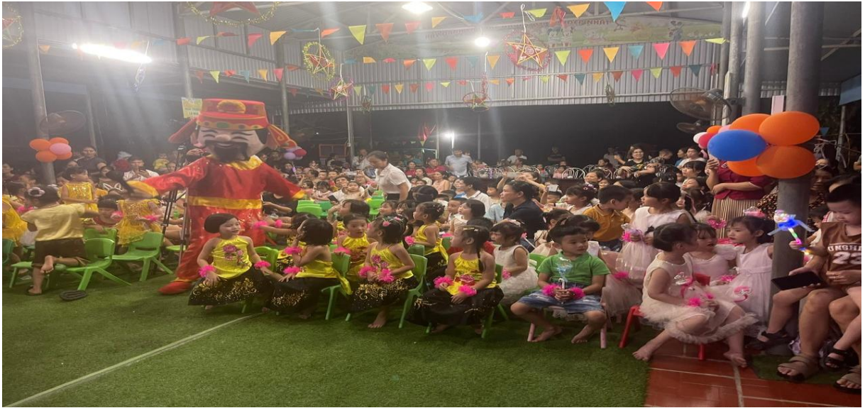
Hình ảnh phối hợp trong ngày tết trung thu