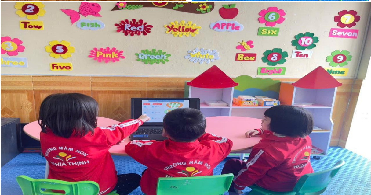
Hình ảnh trẻ đang chơi các trò chơi trên máy vi tính