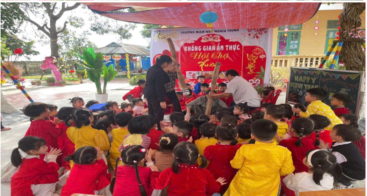
Hình ảnh trẻ đang cùng phụ huynh trải nghiệm gói bánh chưng, giã bánh dày