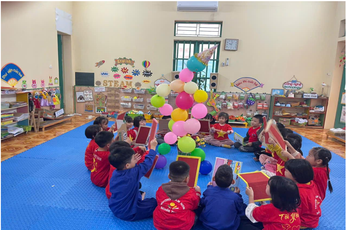
Hình ảnh trẻ đang chơi “Người bóng nhảy múa”