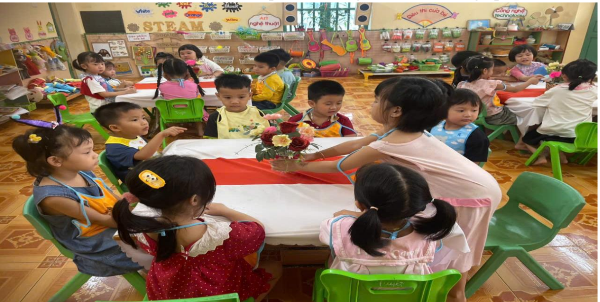
Hình ảnh trẻ đang chuẩn bị bàn ăn

Trẻ được tham gia vào một số công việc vừa sức như: cùng cô chuẩn bị bàn ăn, lấy khăn, xếp bát thìa, mời bạn, mời cô trước khi ăn. Tôi khuyến khích trẻ tự xúc ăn, lựa chọn vị trí ngồi, trò chuyện nhẹ nhàng về món ăn để kích thích hứng thú. Những lời khen kịp thời, ánh mắt động viên giúp trẻ cảm thấy tự tin, vui vẻ khi ăn, từ đó hình thành thói quen ăn uống tích cực, không áp lực.