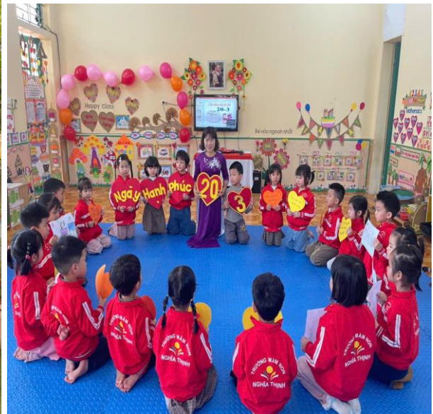
Hình ảnh trẻ nói lời yêu thương trong ngày Quốc tế hạnh phúc