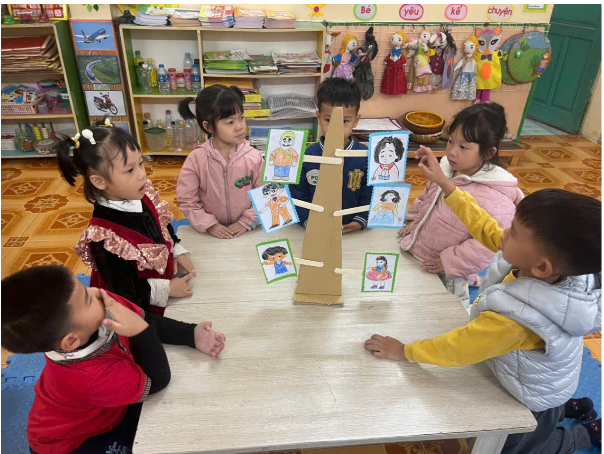
Hình ảnh trẻ đang thiết kế cây gia đình

Sau khi làm được ra sản phẩm cô cho trẻ thử nghiệm sản phẩm để từ đó rút ra kinh nghiệm