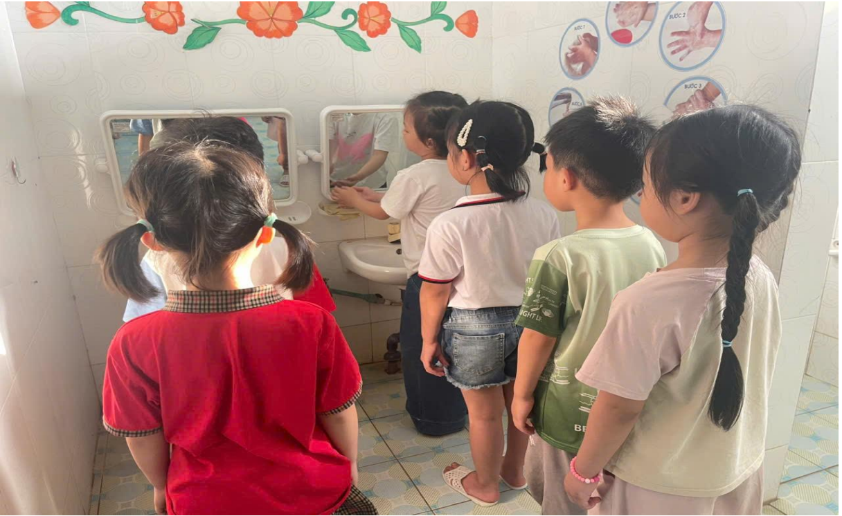
Hình ảnh trẻ đang rửa tay trước khi ăn

Giờ ăn tôi cho trẻ tự lấy ghế, lấy đĩa đựng cơm rơi và lấy khăn lau tay, khuyến khích trẻ tự xúc ăn. Để cho trẻ tích cực hơn tôi đã phân công theo tổ cho mỗi tổ thực hiện một tuần thi đua xem tổ nào làm tốt nhất. Ngủ dậy trẻ tự cất gối, gấp chăn, chiếu giúp cô