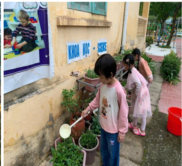
Hình ảnh trẻ đang lao động nhặt lá, chăm sóc cây

Ra ngoài trời trẻ không chỉ được khám phá thiên nhiên mà trẻ được tham gia rất nhiều các trò chơi vận động, trò chơi dân gian, chơi với đồ chơi ngoài trời