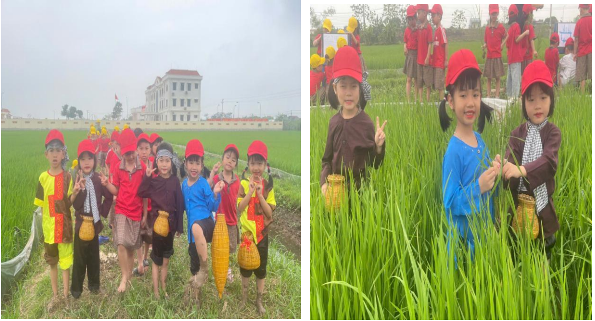
Hình ảnh trẻ trải nghiệm tham quan cánh đồng lúa

Sau buổi trải nghiệm, tôi tổ chức cho trẻ cùng trò chuyện, chia sẻ cảm xúc thông qua các câu hỏi gợi mở như: