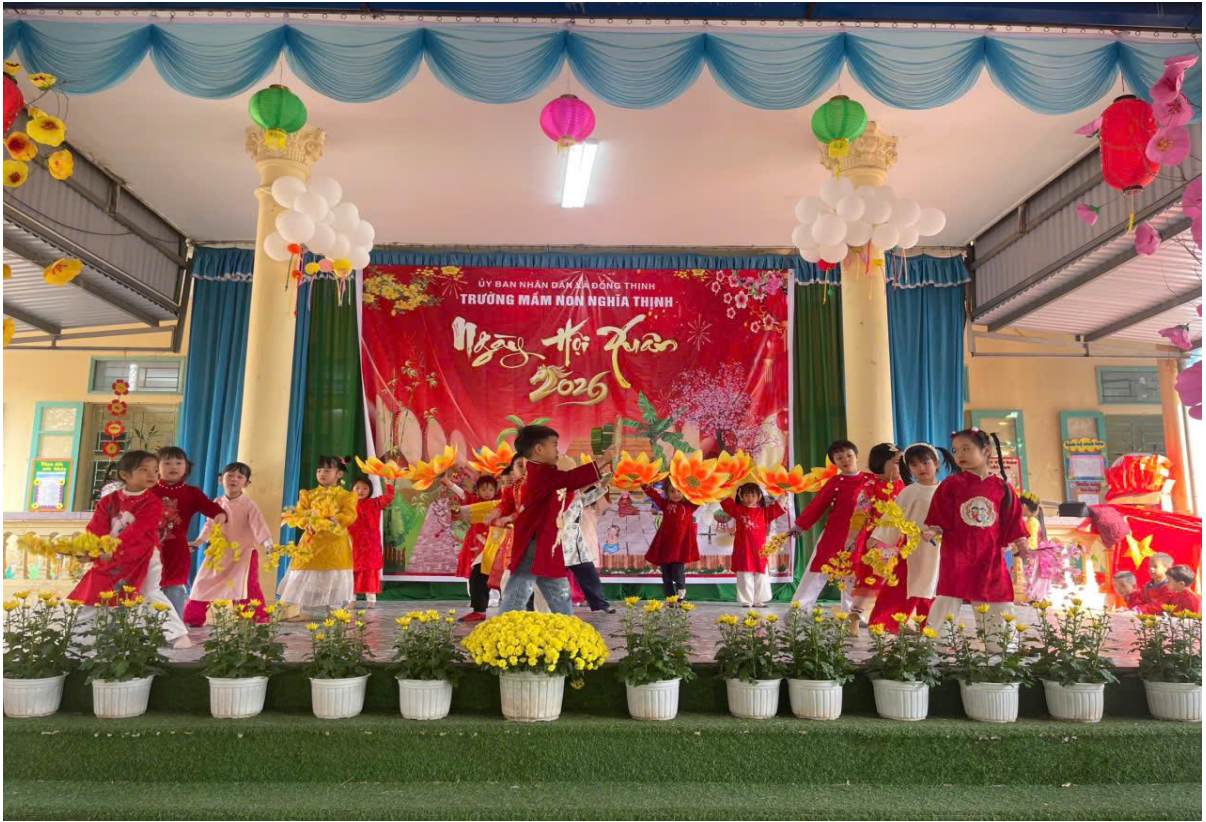
Hình ảnh trẻ đang biểu diễn văn nghệ