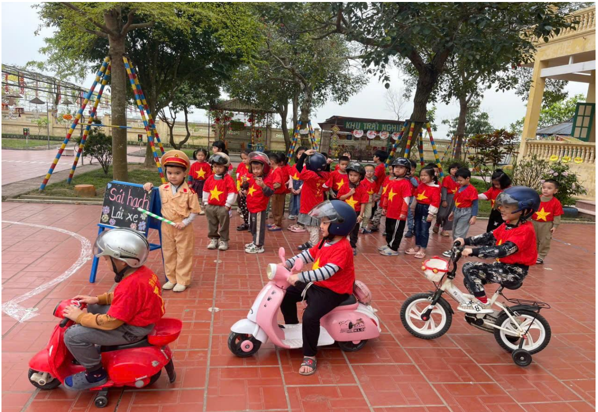
Hình ảnh trẻ đang chơi trải nghiệm ở sân chơi giao thông